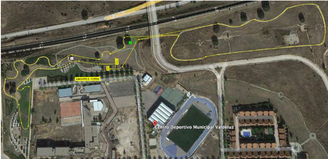
Circuito C – 2.250m